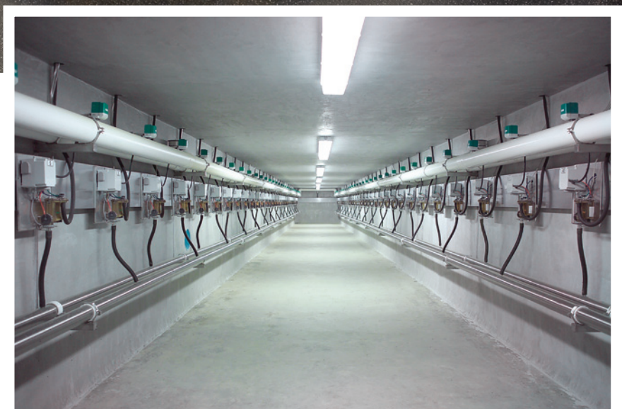
Exécution : Global 90i Subway

Avec cette exécution, les composants de l'équipement de traite importants pour le service sont montés en dessous de la fosse de traite (Central-Subway) ou en dessous du niveau du sol des animaux (Dual-Subway). Le système Subway offre la garantie d'un environnement de travail propre, plus sec et facilement accessible et permet d'effectuer les travaux d'entretien même lorsque la traite est en cours. La durée de vie de tous les composants importants est ainsi prolongée.